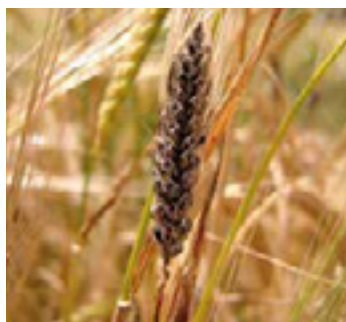
Тверда сажка (колос)