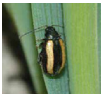
Блішка смугаста хлібна