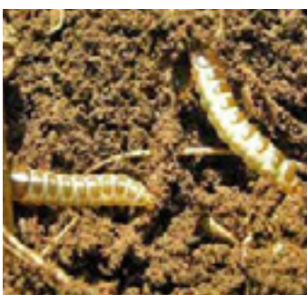
Личинки жужелиці Zabrus