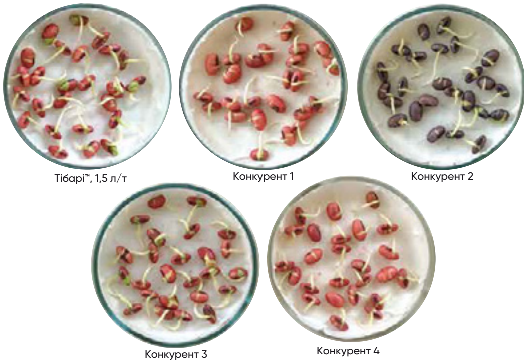
Фото 1. Вплив різних протруйників на лабораторну схожість та енергію проростання насіння сої в чашках Петрі, 2023 р.